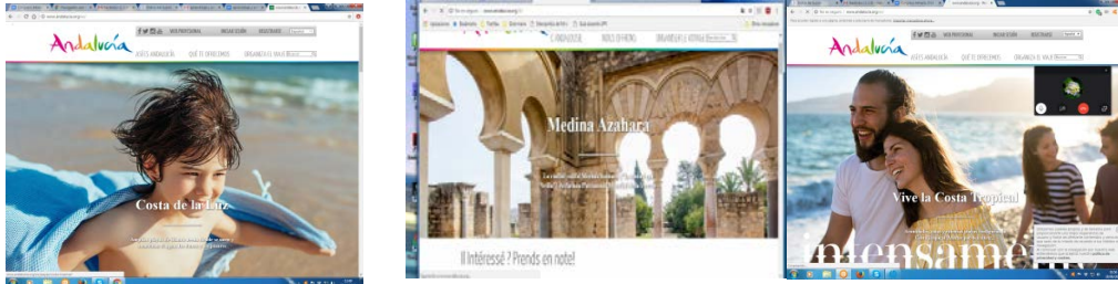
Figura 1: Imágenes principales de la Web Oficial de Turismo de Andalucía

felices sobre la arena) así como con el turismo cultural (templo de Medina Azahara, Patrimonio Mundial de la Humanidad). En definitiva, los dos pilares fundamentales en los que se basan las últimas campañas publicitarias sobre la Comunidad Andaluza son dos clásicos de la oferta turística: el atractivo del mar y el sol del sur de España así como el exotismo de la arquitectura de origen árabe.