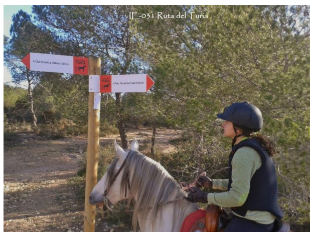
Figura 3. Itinerario Ecuestre IE-031 "Ruta del Turia" (Valencia)

IE-038), siendo en la actualidad una de las regiones con mayor desarrollo de este tipo de viales.